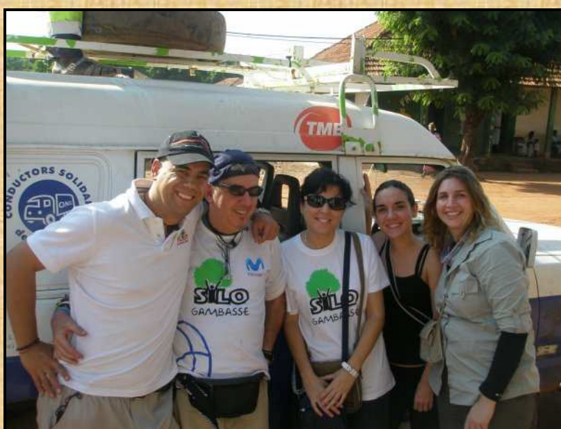
Part del segon grup

L'estada del segon grup, en el que hi havia diversos membres representants de Rotaract i Rotarys de Barcelona, va dedicar-se, sobretot, a l'inici de la construcció del centre nutricional de Gambasse , ja que són ells els qui l'han subvencionat. Cal comentar que serà una de les construccions de més qualitat fetes fins ara, com podeu apreciar en les fotografies, i com sempre, és construïx amb recursos materials i humans del país. El terreny ha estat cedit per la comunitat que participa en les tasques de construcció anant a buscar aigua pel ciment, sorra, pedres... Destacar que no només la pròpia població de Gambasse ha participat en aquestes tasques sinó que gent d'altres poblats també s'han desplaçat per ajudar, majoritàriament dones.