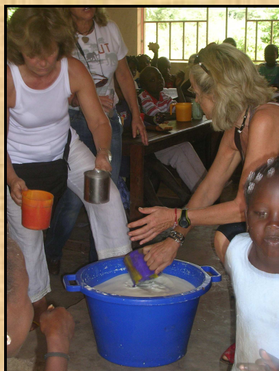
Repartint llet a una escola