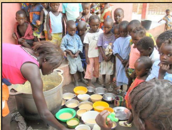
Repartiment de farinetes