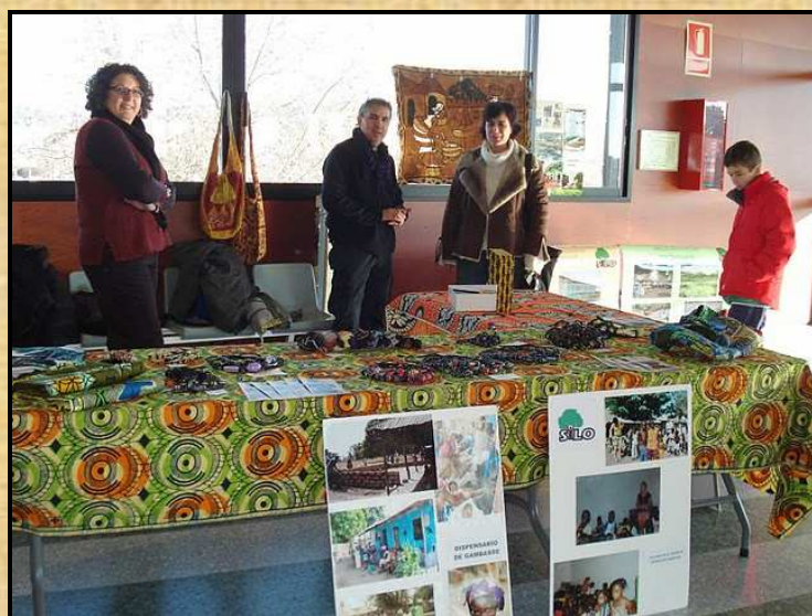
Stand de Silo a la mostra de Girona Judo Solidari

Agrair, un any més, la col·laboració de Girona Judo Solidari , que en la seva mostra d'aquest esport ha difós i recaptat fons per a les nostres accions.