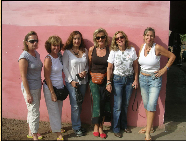
Col·laboradores habituals de Silo

En aquest segon grup va afegir-se un equip de col·laboradores habituals de Silo que com sempre assoleix l'objectiu d'oferir un suport nutricional als infants, i de subministrar materials educatius a les escoles.