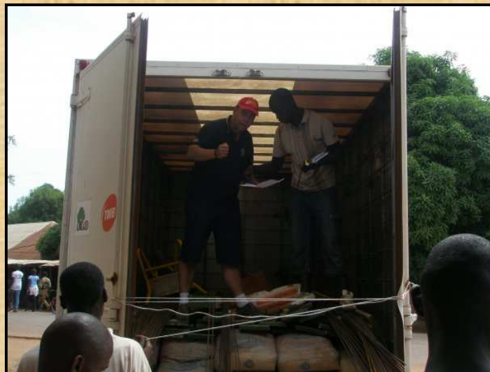
Imatges del camió carregat de ciment per la construcció del centre nutricional