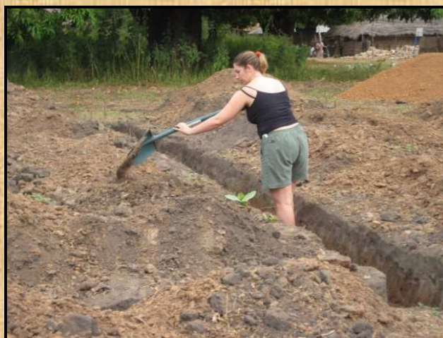
Inicis de la construcció del centre nutricional